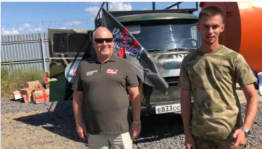
Герой Российской Федерации Олег Пивоваров